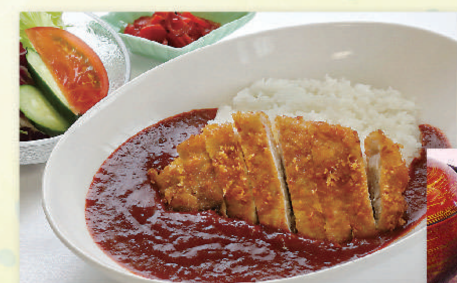
レッドカツカレー