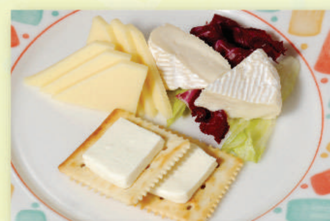
チーズ盛り合わせ