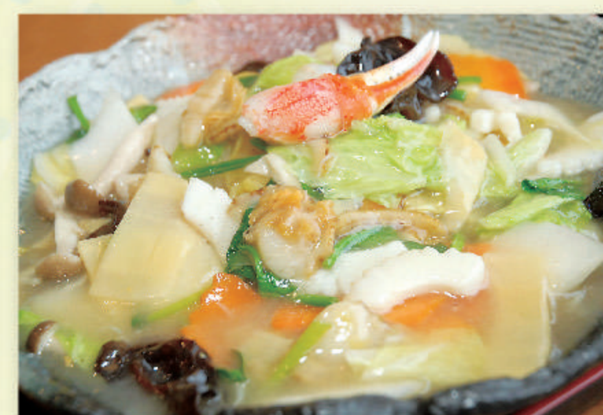
海鮮塩チャーメン