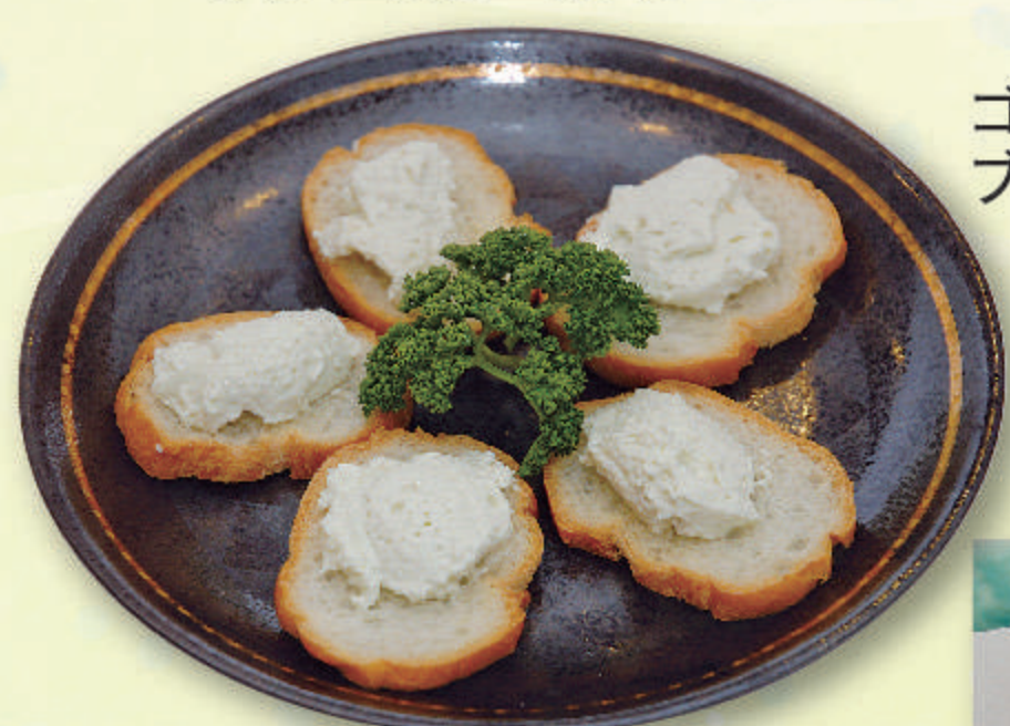
ゴルゴンゾーラムースのブルスケッタ