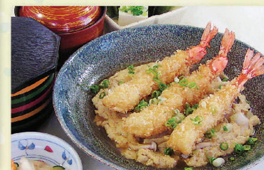
エビフライ玉子とじ定食